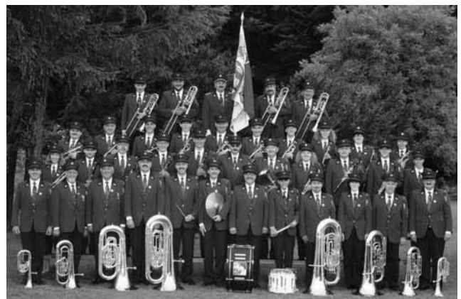
Die Konkordia am Eidg. Musikfest 1996 in Interlaken

schrieb im 19. Jahrhundert: „Der Erfolg ist nur eine Folgeerscheinung und darf niemals zum Ziel werden.“ Wir werden sicher unser Bestes geben und sehen, was wir erreichen werden.